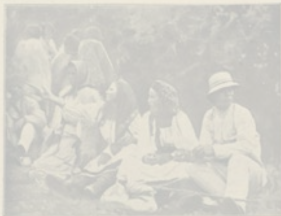
Téli rutinnak a kórház szobáiban.