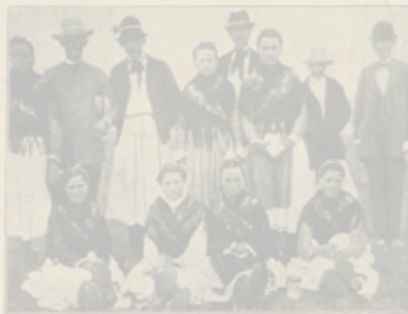
Feladórvezetési rutinnak a szociális intézetben.