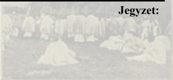
Hálgyógyi rutinnak az ébél kórházban.

Az előadásban azt szeretném bemutatni, hogy az 1900-tól megrendezett országos katolikus nagygyűléseken, a társadalmi szervezkedés jelentős fórumain, milyen törekvéseket fogalmaztak meg néhány részterületen – a sajtó, a szövetkezeti mozgalom, a népművelés, a mértékletességi egyesületek és a kivándorlás ügyében –, és ezek hogyan érhetőek tetten a korszak görögkatolikus közgondolkodásában.